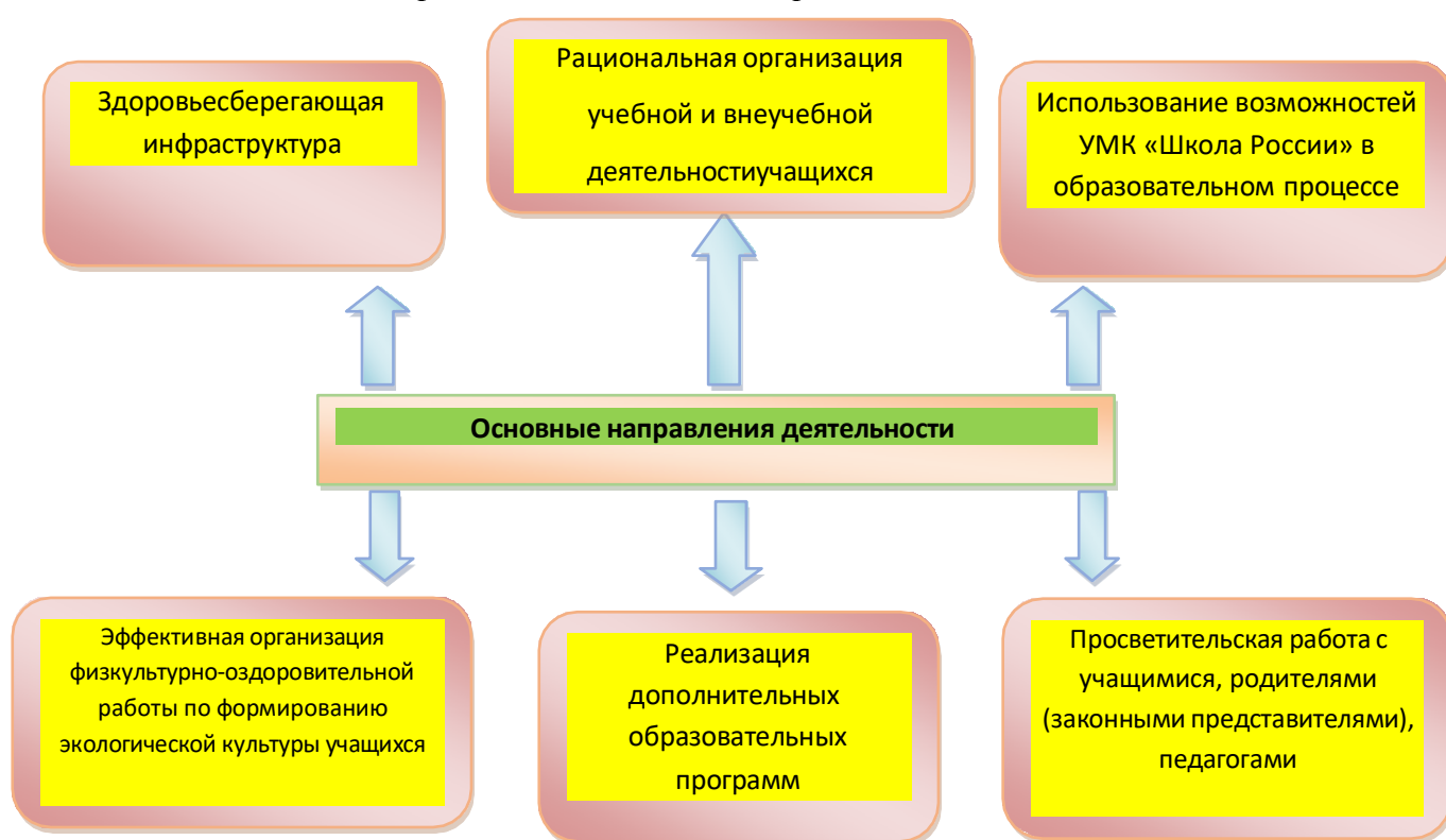
Рис. Основные направления деятельности в рамках ЗОЖ

Работа по формированию экологической культуры, здорового и безопасного образа жизни на уровне начального общего образования ведется по направлениям: